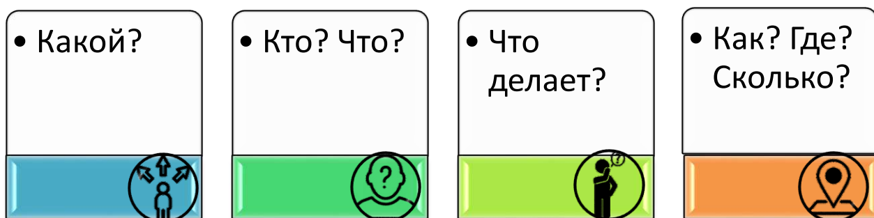
Рисунок 1. Алгоритм создания предложения – небылицы

Непейвода Е.Е. и Власенко В.С. разработали алгоритм, следуя которому ребенок получает возможность самостоятельно придумать предложение-небылицу [13]. Казалось бы, что сложного в том, чтобы придумать несуразное предложение: можно все подряд соединить в предложении, и получится что-то такое, чего на самом деле не бывает. Однако тогда вместо небылицы мы получим обрывки несвязного предложения. С помощью метода наглядного моделирования была создана схема (рисунок 1).