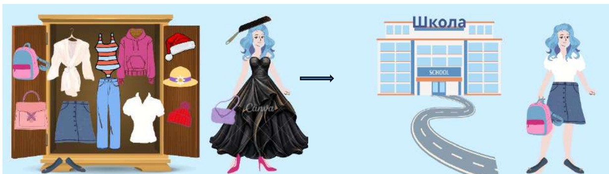
Рис. 3 – Интерактивная игра «Помоги рассеянному персонажу»

что сковороду на голову надевал рассеянный с улицы Бассейной – персонаж К.И. Чуковского из известной небылицы.