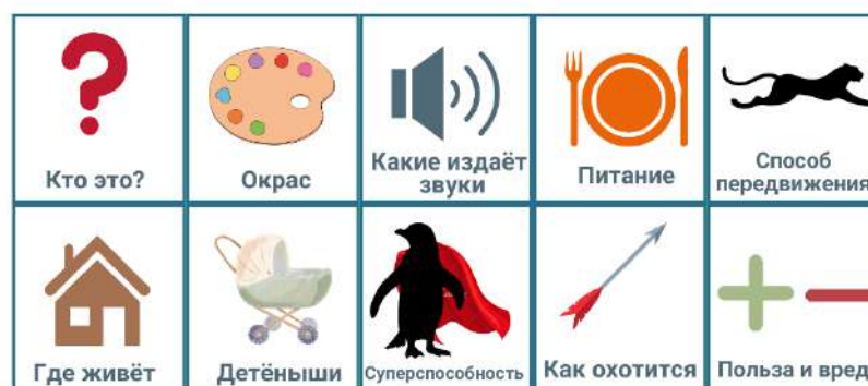
Рис. 2.– Мнемосхема

«Помоги рассеянному персонажу» – цифровая игра, в процессе которой дети с помощью технологий интерактивной доски помогают герою сменить гардероб на соответствующий определенному случаю. На рис.3, например, изображена Мальвина, которую нужно переодеть для похода в школу выбрав одежду из ее гардеробной. Для выполнения условий этой игры, ребенку потребуется вспомнить в какой ситуации уместен тот или иной наряд. Также в игре встречаются совсем комичные персонажи, как, к примеру Мальвина со сковородой на голове. Здесь необходимо актуализировать в памяти детей то,