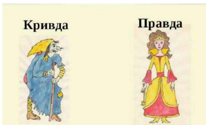
Рис. 5 – Игра «Правда-кривда»

Следующим этапом родители могут включать игры с небылицами, в частности словесные. Ведь в них так легко играть в то, время, когда под рукой ничего нет: по дороге куда-либо, в транспорте, в очереди. Такие игры на ходу будут также положительно влиять на концентрацию внимания. Самые известные, это «Скажи наоборот», «Правда-кривда», «Вредные советы», «Создатели новых слов», «Так бывает или нет», «Перевертыши названий произведений (мультфильмов)», «Исправление ошибки в слове», «Странные рассказы», «Помоги двоечнику» (рис.5).